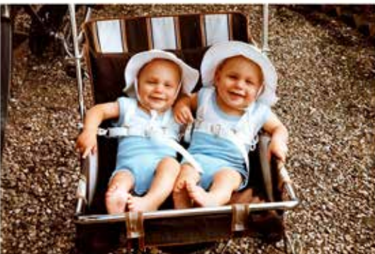
This is me This is me